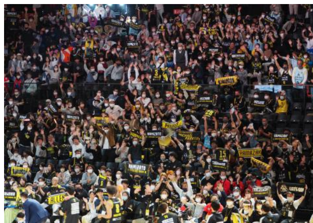
▲観客席の様子。超満員の観客と声援が会場の熱気を生み出していた