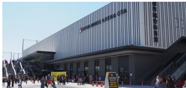
▲多くの人で賑わっていたアリーナ前