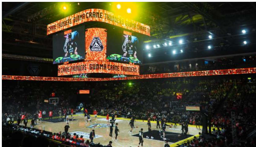
▲アリーナ入場者を最初に出迎える圧巻のセンターハングビジョン

4月15日(土)にオープンを迎え、太田市の新たな目玉施設となった新体育館「オープンハウスアリーナ太田」。5000人収容が可能なメインアリーナのほか、国内最大級の14面の組み合わせた可動式センタービジョンや劇場型照明、国内で初導入されフランス製の音響設備は天井にスピーカーが50機、サブウーハーが24機にわたり設置されるなど注目の新施設となっています。