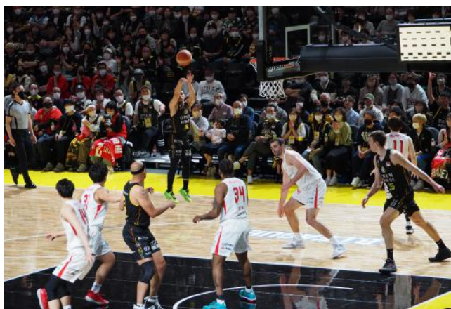
▲試合の様子。2階席からでも選手の表情や背番号がみえるなど非常に観戦しやすい