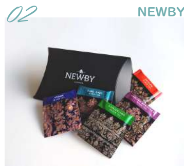
02 NEWBY ティーバッグお試しセット