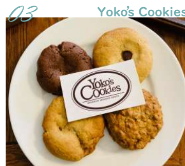
03 Yoko's Cookies ミニクッキー 8枚ギフト