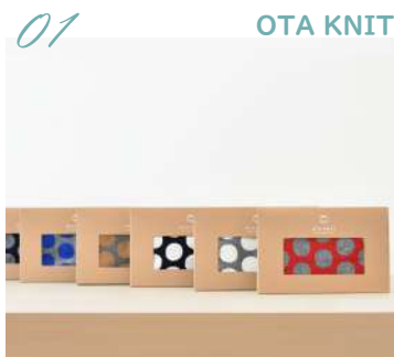
01 OTA KNIT ファインウール ドットマフラー／ リバーシブルマフラー

賃金確定闘争に向けて組合員の意見を集約するためにアンケートを実施します。身近な職場の悩みからハラスメントの実態調査のほか、組合に期待することなど自由に声をお寄せください。アンケートは下記のURLまたはQRコードを読み取り、スマホ等から回答をお願いします。また、アンケートにご協力頂いた方には抽選で下記景品を贈呈いたします。