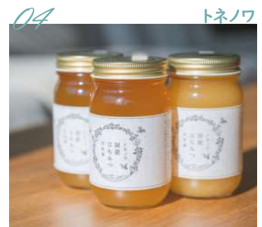
04 トネノ 国産はちみつ ～百花蜜～